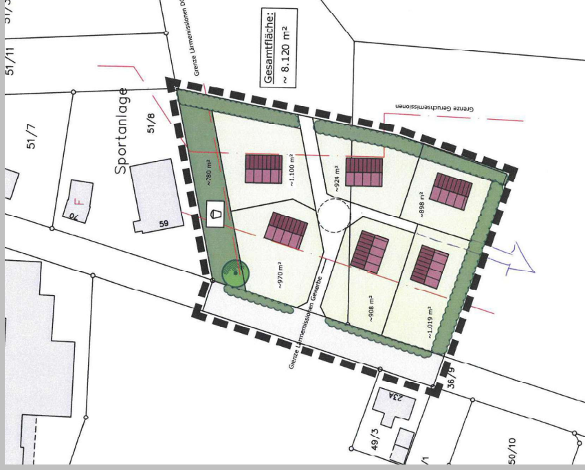
neu, Variante 1