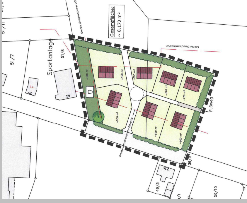
neu, Variante 2