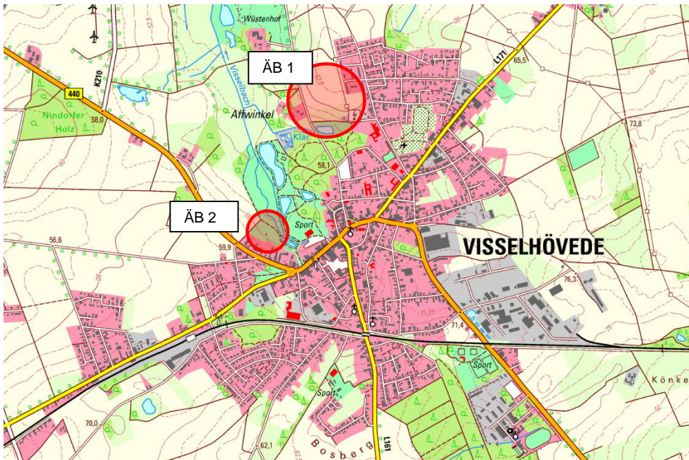
Abb. 2: Lage der Planänderungsgebiete (ohne Maßstab) - Bundesamt für Kartographie und Geodäsie © 2020

Im Planänderungsgebiet 1 an der Eichenstraße befinden sich Gebäude und technische Einrichtungen für die Stromversorgung sowie ein Garagengebäude der Johanniter-Unfallhilfe. Südlich der Eichenstraße liegt ein Regenrückhaltebecken. Die übrigen und somit überwiegenden Flächen im Planänderungsgebiet werden landwirtschaftlich genutzt. Im südlichen Randbereich dieser Flächen und entlang der Hochspannungsleitung sind bereits Ausgleichsmaßnahmen erfolgt.